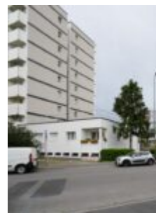
Milano, conclusi riqualificazione di via Russoli