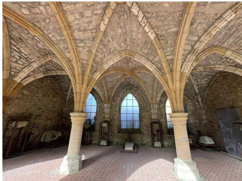
Abbazia di Orval e sopra quella di Scourmont