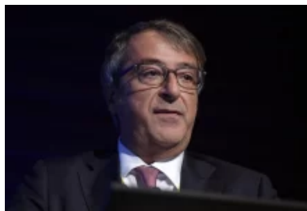
Sanità, Cartabellotta: “Sistema pubblico indebolito e quello sanitario attuale è fatto di crisi dentro la crisi”