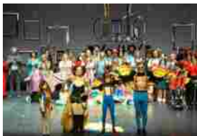
Epoica dell'Irrealtà di Niguarda, tour da domenica 8