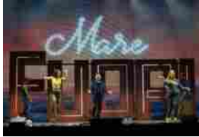
TAM 2024-25, una stagione incontentabile