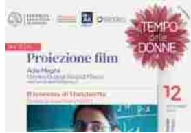
Il teorema di Margherita, giovedì 12 in Statale