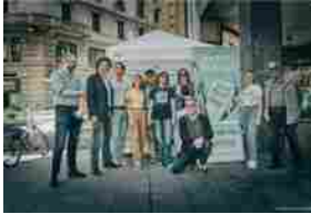
Fine vita e diritti civili, tre appuntamenti in Statale