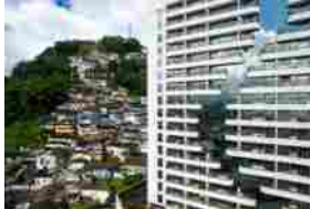
Triennale, gli appuntamenti della prossima settimana