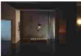
Scopri la Stagione Teatrale di Triennale Milano 2024