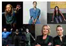
Tornano i #FollowTheMonday al Carcano