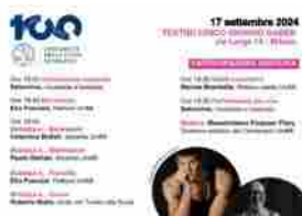
Raccontare la bellezza, martedì 17 Teatro Lirico