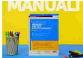
Nuovi Manuali di Studio Simone: Record di Pubblicazioni 2023