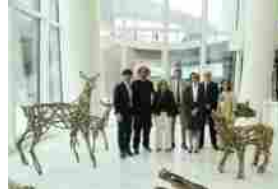
PwC e Accademia Carrara: Opere di Sedicente Moradi in Piazza Tre Torri