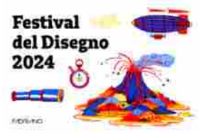
Festival del Disegno, prossimo weekend al Castello Sforzesco