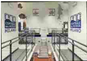
MM, tornano le mostre alla Centrale dell'Acqua